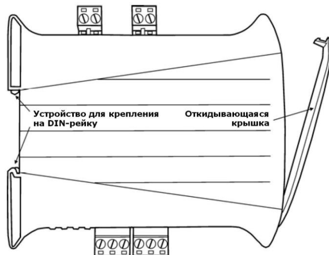
Рисунок 4 Внешний вид модуля CHQ для монтажа на DIN-рейку

Положения переключателей в зависимости от адреса модуля приведены в таблице адресов (рисунок 5).